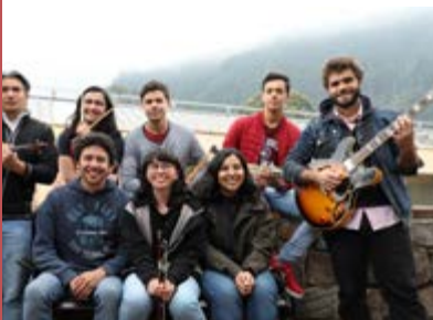
Imagen: Óscar Aquite