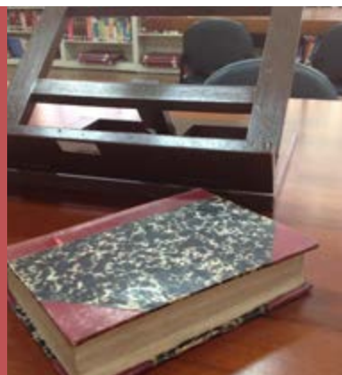
Imagen: Manuel Saavedra