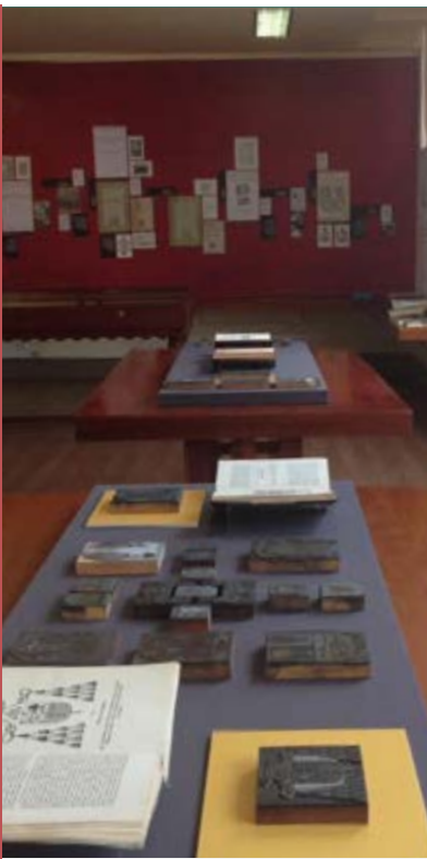
Imagen: Biblioteca Nacional de Colombia