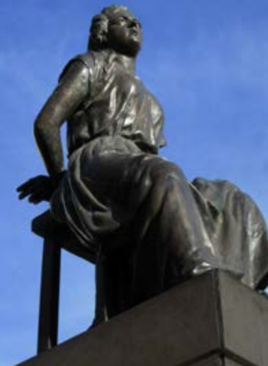
Imagen con licencia CC BY-SA 4.0, tomada de wikimedia.org