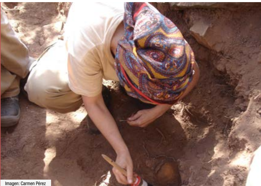
Imagen: Carmen Pérez