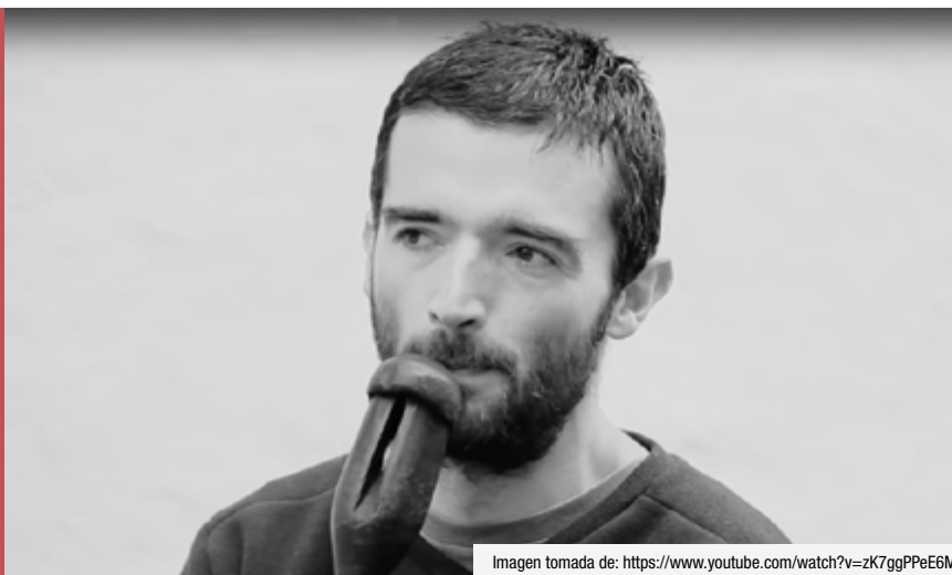
Imagen tomada de: https://www.youtube.com/watch?v=zK7ggPPeE6M