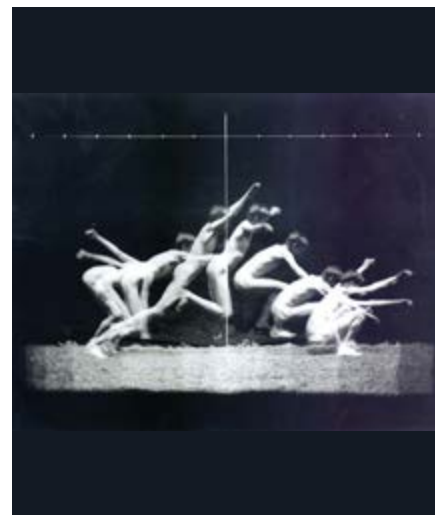
La figura humana en movimiento. Autor: Edward James Muggeridge. Derechos: Creative Commons - Attribution-ShareAlike 2.0 Generic (CC BY-SA 2.0)

El Banco de Archivos Digitales de Artes en Colombia (BADAC) es un repositorio temático multimedia perteneciente a la Facultad de Artes y Humanidades de la Universidad de los Andes, que custodia y divulga archivos físicos y digitales sobre creación e investigación de las artes en Colombia. Su misión es reunir, organizar, digitalizar, conservar y divulgar documentación en diferentes medios y soportes sobre el tema, con el fin de ponerlo a servicio de la comunidad para su libre acceso y consulta.